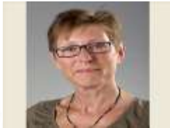
Els Butter Gynaecologie